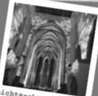
Lichtershow Infinity, Minoritenkirche