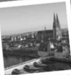
Stadt(ver)führung mit der Stadtmaus