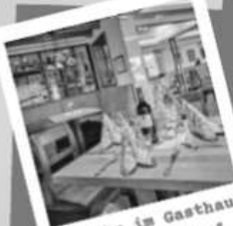
Einkehr im Gasthaus Wurm, Bärndorf