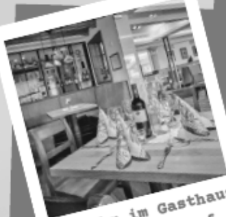
Einkehr im Gasthaus Wurm, Bärndorf