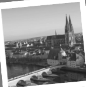
Stadt(ver)führung mit der Stadtmaus