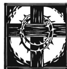
Karfreitag „Es ist vollbracht.“