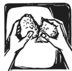
Du brichst das Brot mit uns.

Bei Ausgangssperre: allgemeine Gebetswache bis 22 Uhr