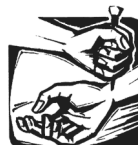
Du wirst gebrochen.

19.00 Schwarzach: Novene zur göttlichen Barmherzigkeit